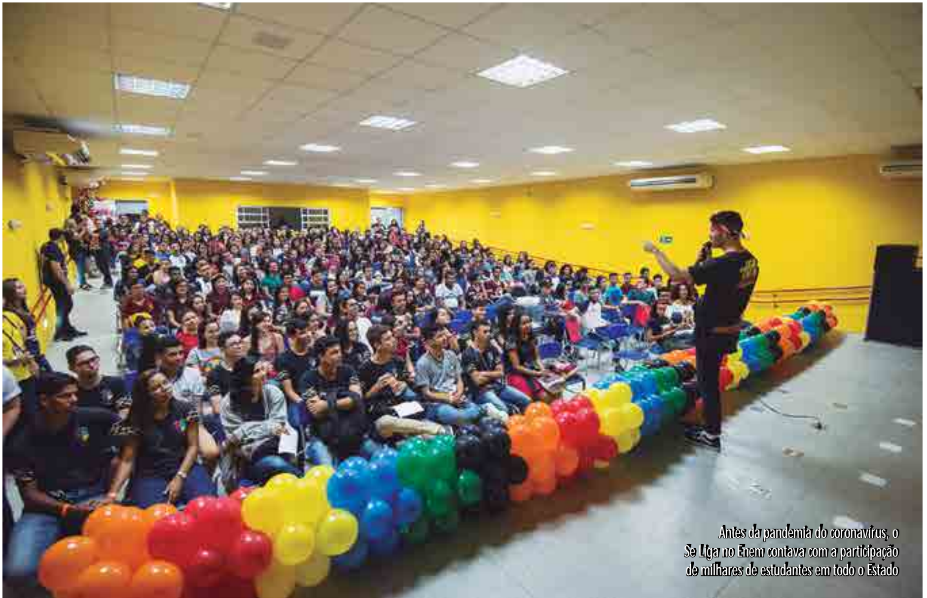
Antes da pandemia do coronavírus, o Se Liga no Enem contava com a participação de milhares de estudantes em todo o Estado

De acordo com o governador João Azevêdo, as aulas vão acontecer de segunda a sexta-feira em ambiente virtual, por meio da plataforma Google Classroom, em horário alternativo às aulas regulares, utilizando atividades através do site: www.see.pb.gov.br/pbeduca . "A ação da Secretaria da Educação tem mantido um foco muito grande nesse momento de pandemia, em que sabemos que, pela suspensão das aulas presenciais, temos que oferecer uma estrutura tecnológica para que os alunos continuem estudando", frisou o governador, acrescentando que o Governo do Estado também vai disponibilizar recursos como vídeo aulas, textos em PDF, atividades e simulados on-line, além de acompanhamento das propostas de redação.