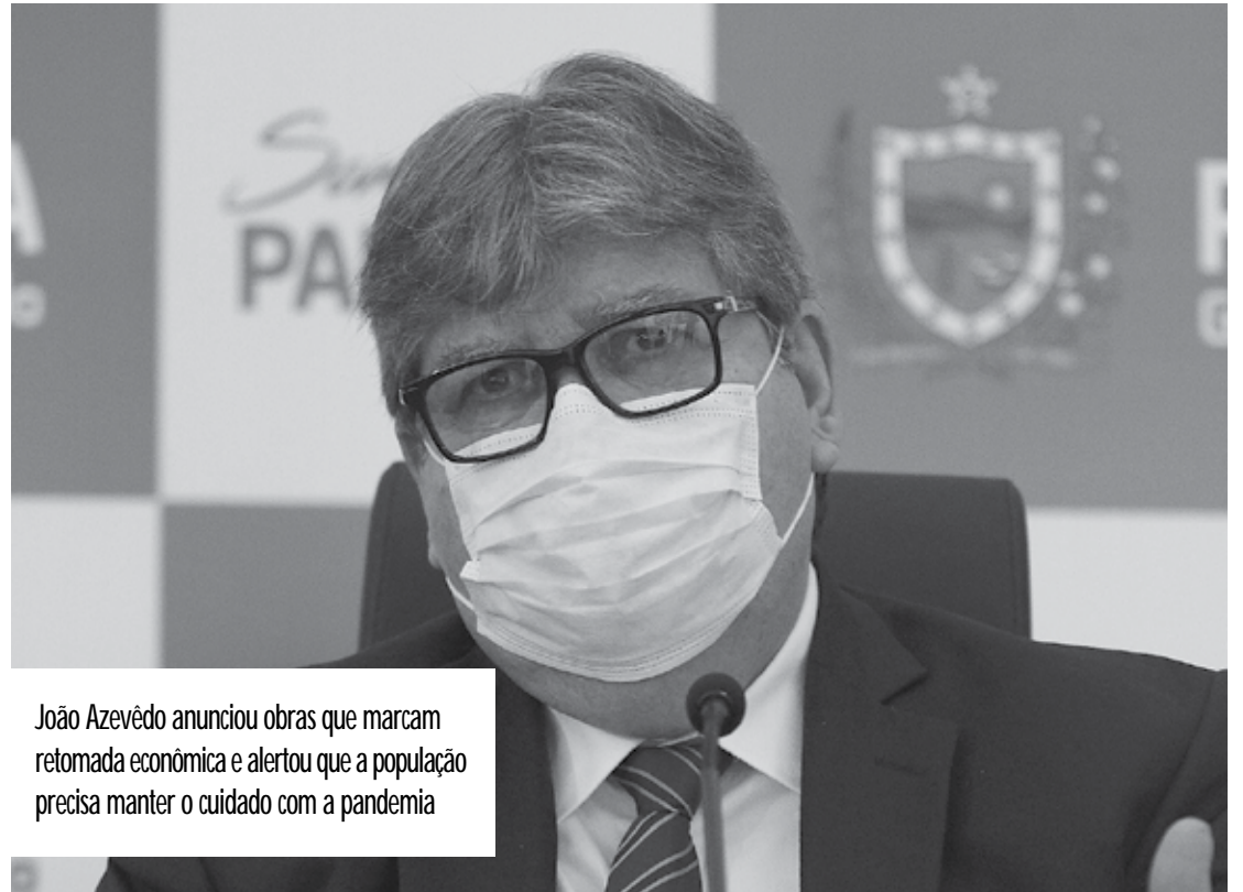
João Azevêdo anunciou obras que marcam retomada econômica e alertou que a população precisa manter o cuidado com a pandemia

Antes de encerrar a live, o governador fez um alerta para que a população continue mantendo os cuidados, uma vez que a pandemia não acabou. “Temos que manter todos os cuidados, para que a Paraíba retome o caminho do desenvolvimento, com a geração de emprego e renda que tanto precisamos”, afirmou.