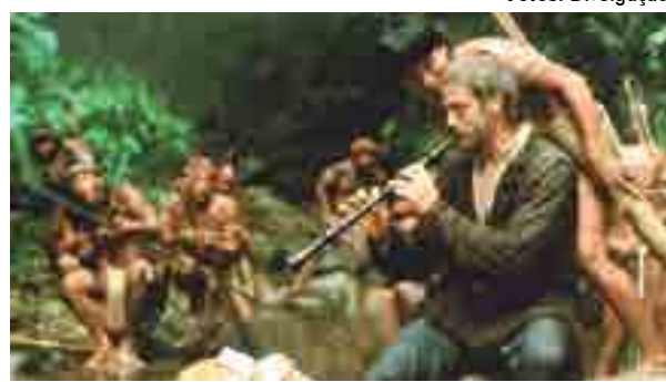
Da esq. para a dir.: gaita na cena inicial de ‘Era uma vez no Oeste’ e assvio em ‘Três Homens em Conflito’, ambos de Sergio Leone; o oboé sonorizando ‘A Missão’, filme de Roland Joffé