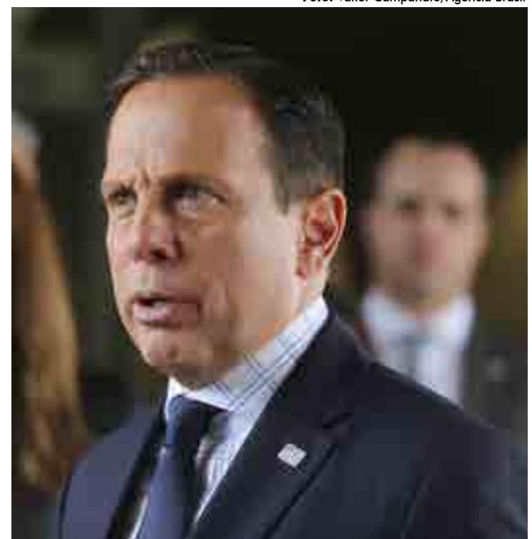
João Doria anunciou ontem a terceira fase de testes com vacina chinesa

Segundo Dimas Covas, caso os testes comprovem a eficácia da vacina, 60 milhões de doses iniciais estarão disponíveis para o Brasil pelo laboratório chinês até o final deste ano. (Com informações da Agência Brasil)