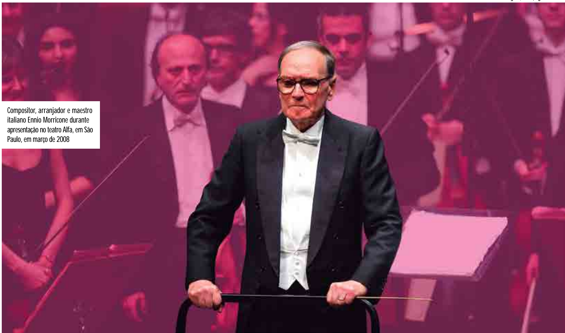
Compositor, arranjador e maestro italiano Ennio Morricone durante apresentação no teatro Alfa, em São Paulo, em março de 2008