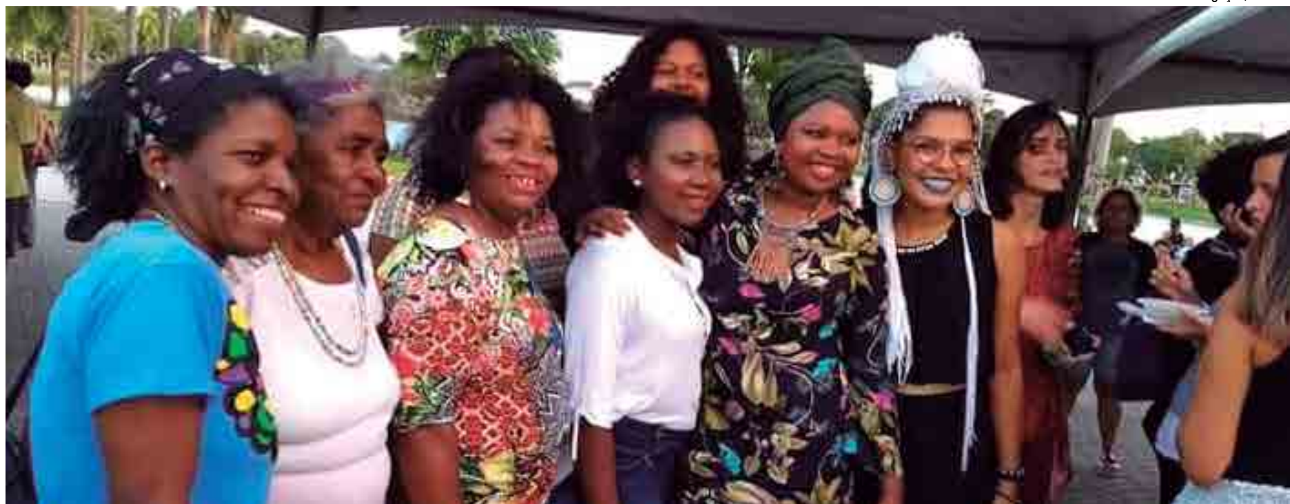
Acima, as mulheres da comunidade quilombola Caiana dos Criolos, que se inseriram no projeto, cuja finalidade é reduzir, através da informação, o contágio da doença na população negra